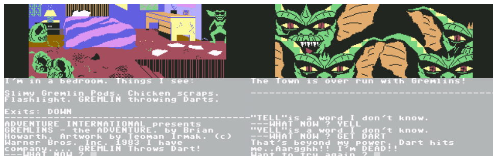
Figure 2. Gremlins : The Adventure (Adventure International, 1985).

Le jeu Gremlins : the Adventure (1985) publié par l'éditeur britannique Adventure International est pour sa part une fiction interactive reprenant le script du film. Le joueur, qui incarne également ici Billy, tape au clavier ses commandes de jeu afin de progresser dans le récit proposé par le jeu vidéo en fonction d'une image et d'une description de la situation (voir Figure 2). Il s'agit ici de résoudre quelques énigmes ou de trouver la bonne démarche pour s'extirper d'une situation de danger, par exemple lorsque les gremlins envahissent la maison des Peltzer puis la petite ville de Kingston Falls. L'adaptation en appelle ici au sens de l'observation du joueur, à sa capacité à trouver les bonnes combinaisons afin de faire progresser la situation et poursuivre le récit calqué sur la chronologie des événements développée par le film. La connaissance préalable du film peut être ici un atout pour progresser plus facilement dans le jeu.